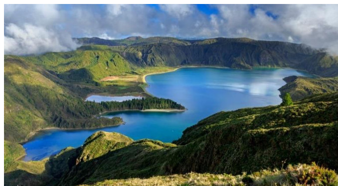
Lagoa do Fogo