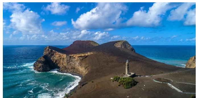
Vulcão dos Capelinhos