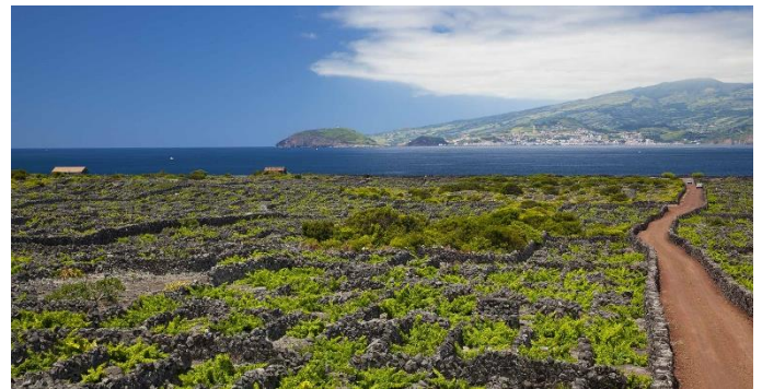
Weinanbau auf Pico

Heute steht die Erkundung der Insel Terceira am Programm. Erstes Ziel ist die Serra do Cume. Von oben hat man am Miradouro da Serra do Cume auf 545m Höhe einen schönen Blick auf den flachen Riesenkrater Caldeira da Guillerme Moniz auf der einen Seite, die Serra do Moriao in Richtung Angra sowie die gesamte Bucht um Praia da Vitoria. Biscoitos ist ein freundliches Städtchen mit Weinanbau an der Nordküste. Weiter geht es zum Algar do Carvão. Eigentlich wäre hier der schönste Schauplatz für die berühmte Geschichte von Jules Vernes: „Die Reise zum Mittelpunkt der Erde“. Stellen Sie sich vor, Sie könnten das Innere eines Vulkans besuchen. Nun, auf den Azoren ist alles möglich. Der Algar do Carvão (E) bietet mit seinem offenen Krater tatsächlich dieses einmalige Erlebnis. Durch ein modernes Besucherzentrum geht es auf bequemen Wegen und über Treppen hinab zur Höhle, die wunderschön aufgrund ihrer mineralogischen Besonderheiten in verschiedenen Farben erscheint. Die Serra de Santa Bárbara zählt neben der Serra do Cume zu den Highlights von Terceira. Die Serra de Santa Bárbara ist mit 1.021m Höhe die höchste Erhebung und bietet grandiose Ausblicke über den gesamten Inselwesten. Zum Abschluss dieser abwechslungsreichen Inselrundfahrt genießen wir noch den Ausblick vom Monte Brasil, dem Hausberg von Angra do Heroísmo. (F)