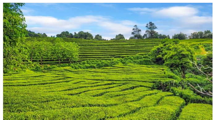
Teeplantage bei Gorreana auf der Insel São Miguel

Am Morgen erfolgt der Transfer zum Flughafen und der Rückflug von Terceira via Lissabon nach Wien. (F)